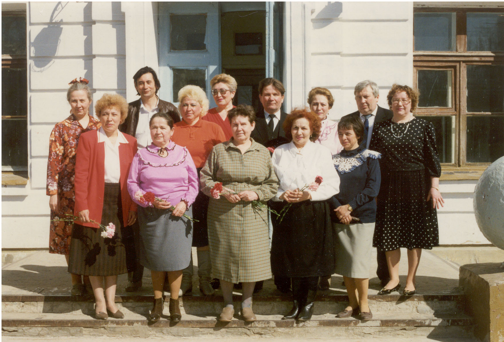
1994 г. 11-я школа г.Ухты. Автор со своими одноклассниками и учителями справляет тридцатилетие выпуска.