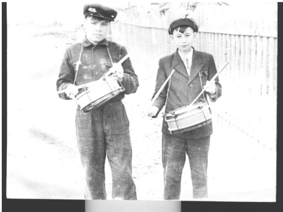
1958 г. В день пионерии.