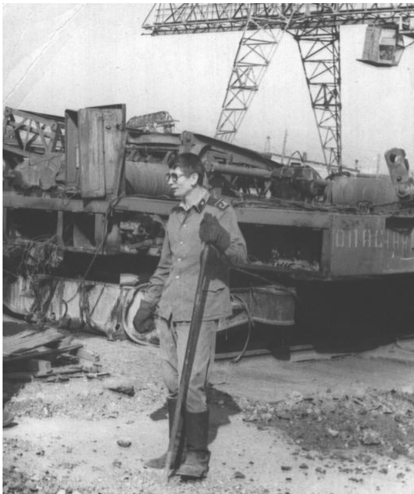
1973 г. Стройбат. Свердловск.