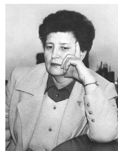
Глава Администрации города Каргалина А.А.