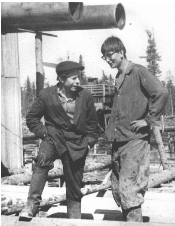
1971 г. Вуктыл. Помбур на буровой № 116.